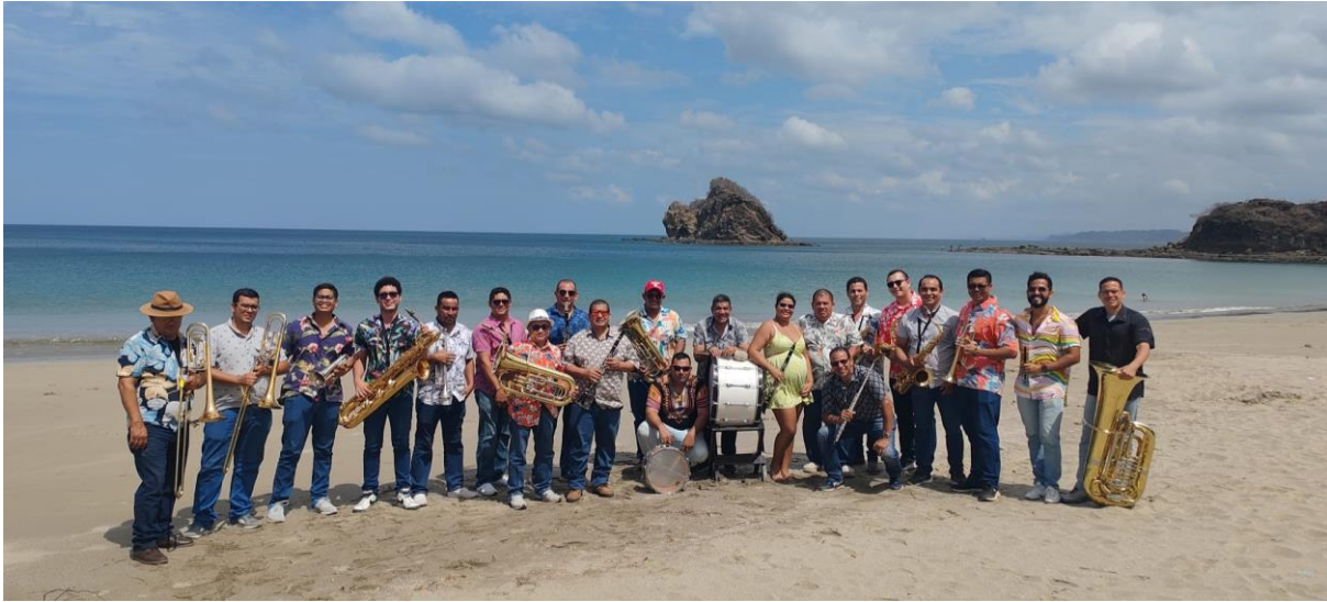
Banda de Conciertos de Guanacaste | Playa Rejada en el cantón de La Cruz El escenario es el mar y la playa - 7 de marzo 2024

Con 32 conciertos ejecutados en el primer semestre, otra de las características que definen al ensamble y que ha tenido resultados importantes durante el semestre es la versatilidad con que la Banda de Conciertos de Guanacaste se hace presente en espacios poco tradicionales e irrumpe alegremente con música con una performatividad espacial que les acerca a la comunidad: plazas, parques, esquinas emblemáticas de las comunidades, playas directamente sobre la arena, paseos turísticos, etcétera.