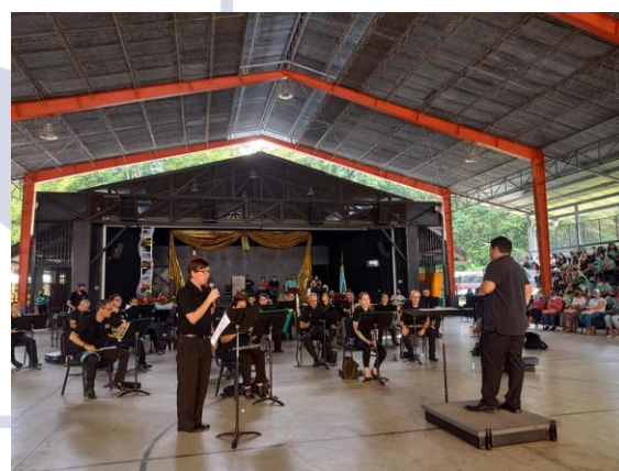
Banda de Conciertos de Heredia | Gira musical den celebración de la Identidad Sarapiqueña Liceo de Río Frío de La Virgen Sarapiquí, 10 de abril 2024