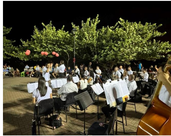
Banda de Conciertos de Puntarenas Concierto Regular de Temporada “Música en El Faro” –Puntarenas, 23 de febrero 2024

La Gira a Zona Sur del 25 al 27 de abril fue uno de los logros alcanzados con la realización de cinco conciertos donde público de todas las edades, principalmente en centros educativos jóvenes y niños disfrutaron de la música.