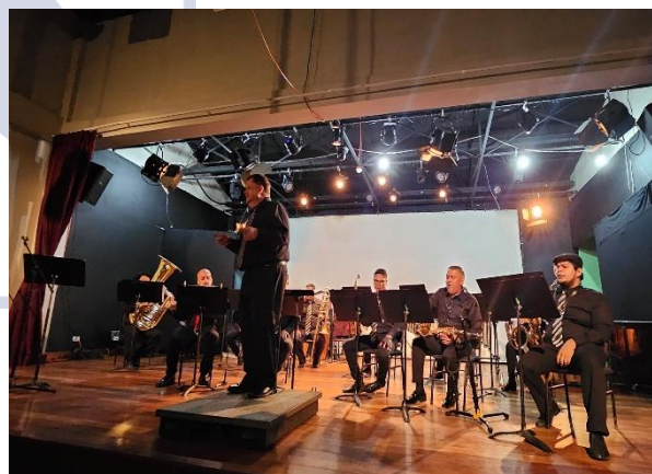
Banda de Conciertos de Limón | Temporada Música en Casa Imágenes de diferentes conciertos en la Casa de la Cultura de Limón, mayo de 2024

Entre los 40 conciertos realizados durante el semestre, son significativos los 10 Conciertos de Extensión fuera cantón central de Limón y un concierto especial para la población de adultos mayores, alcanzando a más de 5000 personas con estas actividades sustantivas.