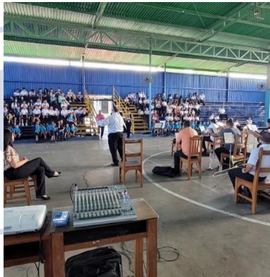
Banda de Conciertos de Cartago | Gira en Corredores, Paso Canoas en frontera con Panamá Política Pública de Atención a la Niñez y Adolescencias 21 de febrero de 2024

Los conciertos educativos forman parte de todos los logros de las Bandas de Conciertos. Nuestro ensamble en Cartago cumplió con sus giras a escuelas, permitiendo a los niños escuchar y participar en conciertos didácticos, promoviendo nuevas y saludables opciones de diversión y aprendizaje.