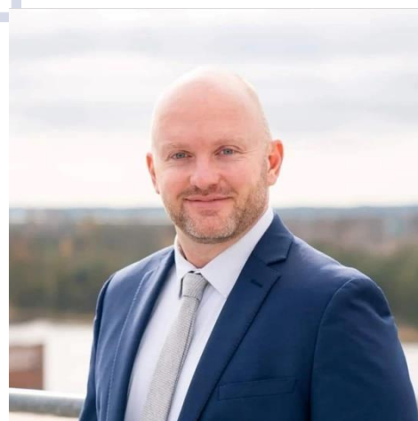
Concierto de Gala I - Banda de Conciertos de San José Dominic Talanca (Estados Unidos) - Teatro La Aduana 4 de abril, 2024