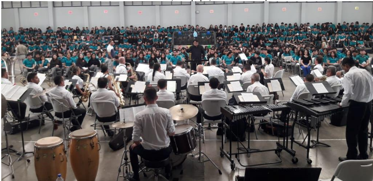
Banda de Conciertos de Heredia | Concierto Educativo en Colegio Técnico Profesional del Este 800 estudiantes y equipo docente disfrutaron del concierto. San Miguel de Santo Domingo de Heredia, 4 de junio de 2024

A la vanguardia en todo el país, la Banda de Conciertos de Heredia se distingue por ser el ensamble con mayor ejecución de música costarricense y particularmente herediana. Su ejecución fue de 103 piezas costarricenses distintas, lo que demuestra un compromiso con la identidad de la provincia y también el trabajo de investigación y rescate de la música herediana y costarricense al dedicar tiempo valioso a la recuperación y copia de obras antiguas para traerlas al presente, rescatando con ello la memoria musical de las y los heredianos.