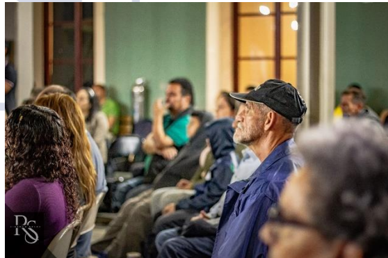
Banda de Conciertos de Heredia y Banda de Conciertos Avanzada de la Escuela de Música de Mercedes Norte Centro Cultural Omar Dengo CCCOD | Junio 2024