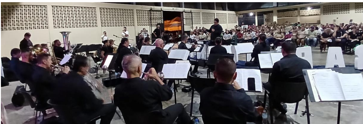
Banda de Conciertos de Heredia | Gira musical den celebración de la Identidad Sarapiqueña Salón Comunal de Horquetas, 10 de abril 2024