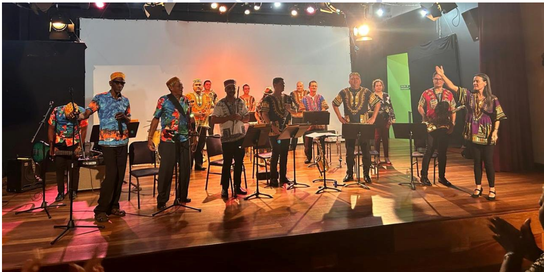
Banda de Conciertos de Limón | Día Nacional del Calypso Homenaje al legado de Walter Ferguson, padre del Calipso costarricense Casa de la Cultura de Limón, martes 14 de mayo, 2024

Además de pertenecer a la región que es cuna del Calipso, nuestro ensamble caribeño ha sido uno de los mayores exponentes en la difusión y el fortalecimiento de la identidad afrocostarricense con destacada presencia en la Celebración del Día Nacional del Calypso en homenaje al natalicio de Walter Ferguson.