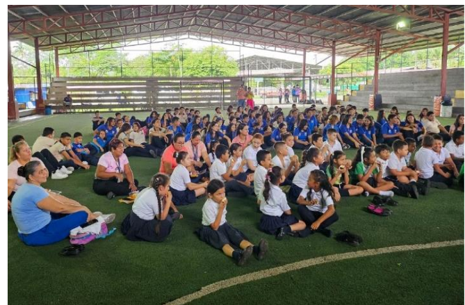
Banda de Conciertos de Limón

Concierto Didáctico, martes 21 de mayo, 2024 en Liceo Académico de Cariari. Circuito 03, Regional Guápiles Estudiantes de la Escuela Campo de Aterrizaje y Liceo de Cariari.