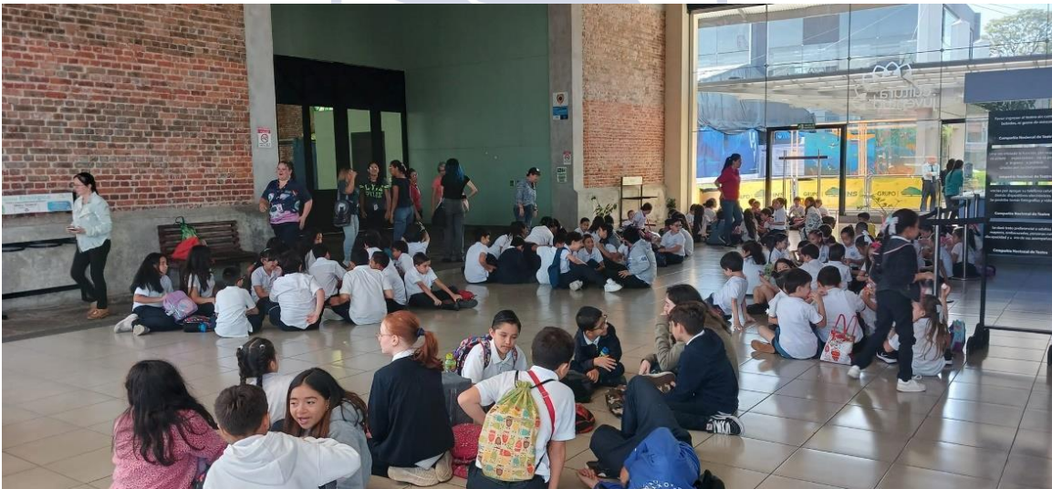
Niñas y niños de centros educativos público y privados esperando su ingreso al Concierto “El Carnaval de los Animales” de la Banda de Conciertos de San José Teatro La Aduana del 11 al 14 de junio 2024