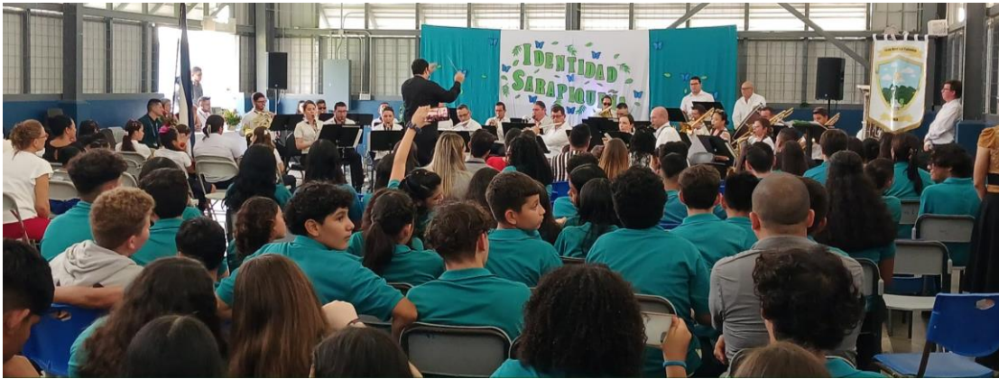
Banda de Conciertos de Heredia | Gira musical en celebración de la Identidad Sarapiqueña Liceo Las Colonias, Sarapiquí, 11 de abril 2024