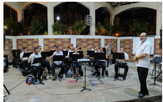
Banda de Conciertos de Puntarenas Concierto en el Anfiteatro de Ciudad Neilly, 27 de abril 2024