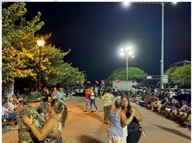
Banda de Conciertos de Puntarenas Concierto Regular de Temporada “Música en El Faro” –Puntarenas, 5 de abril 2024