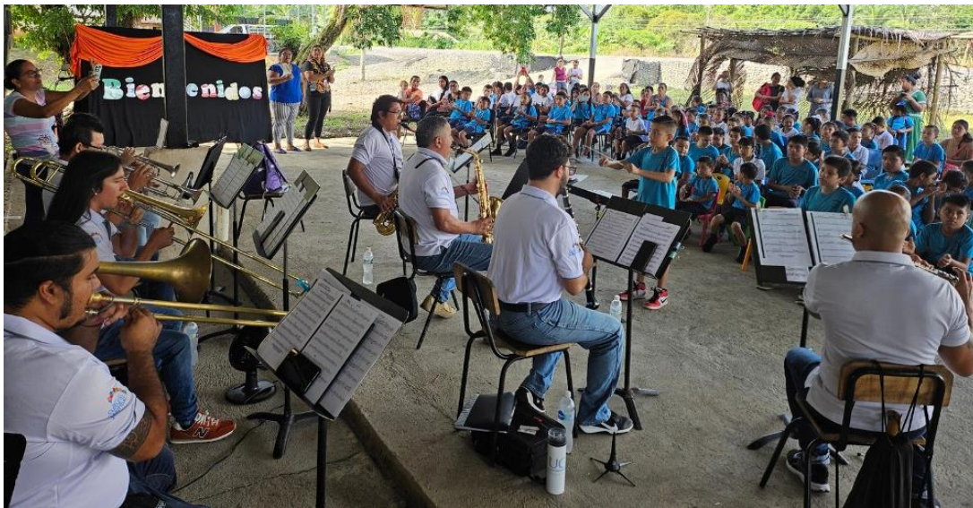
Banda de Conciertos de Limón Martes 4 de junio 2024

La presencia en el Caribe de la Banda de Conciertos de Limón fue fundamental durante esta primera mitad del año con su Temporada de Conciertos Educativos con 15 experiencias musicales que la banda ofreció a centros educativos en escuelas, colegios promoviendo a través de la música ejercicios de motricidad gruesa y diversas actividades musicales, además de enseñar componentes básicos de la música.