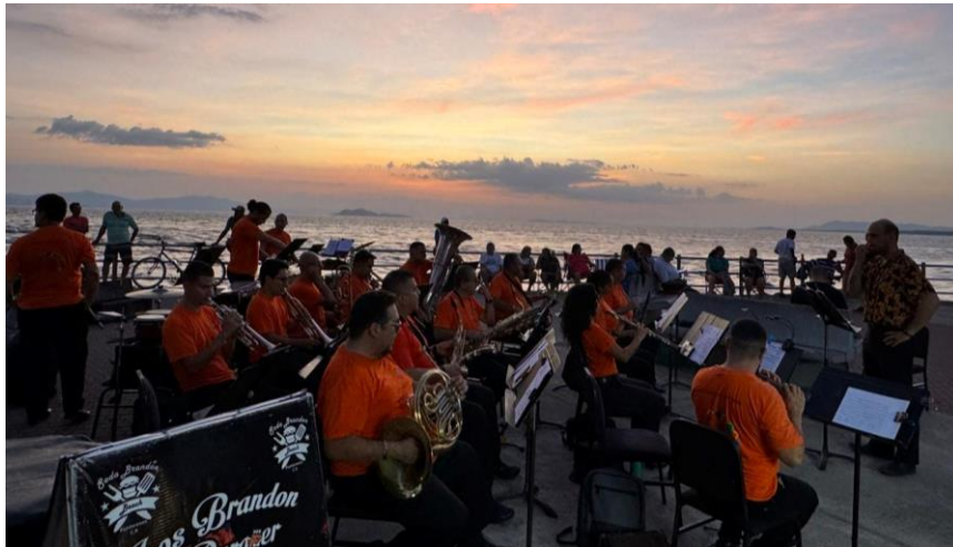
Banda de Conciertos de Puntarenas Concierto Regular de Temporada “Música en El Faro” –Puntarenas, 5 de abril 2024

para la comunidad puntarenense y el turismo nacional e internacional con amplia afluencia, promoviendo cultura de paz y de armonía con el baile de ciudadanas y ciudadanos de la provincia.