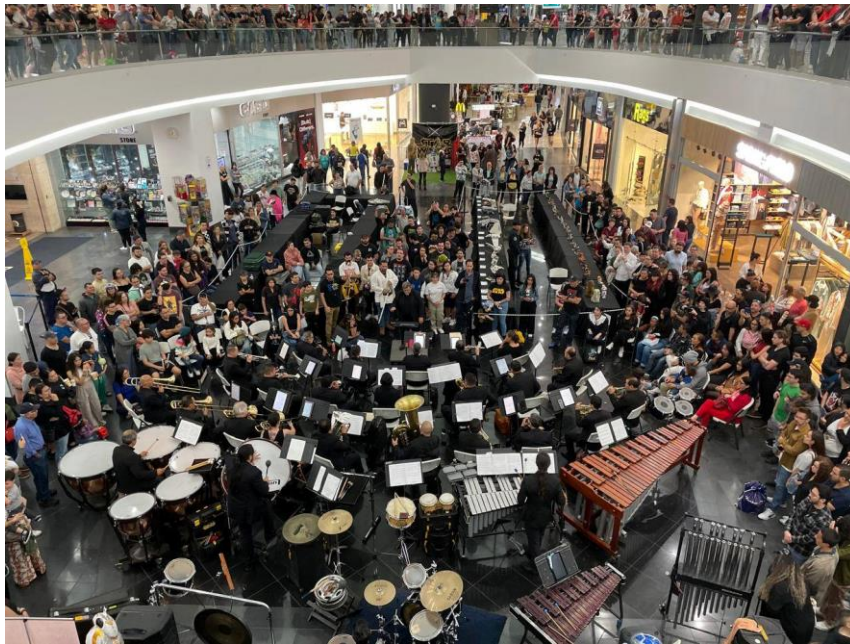
Banda de Conciertos de Cartago | Temporada Música “Star Wars” Paseo Metrópoli, mayo 2024

En lo referente a Concierto Temáticos el Anfiteatro de la Municipalidad de Cartago como sede de estos conciertos aumentó su asistencia fomentando la música con repertorios atractivos de cultura y orgullo Geek, entre otras temáticas y Conciertos Especiales de Efemérides. Con sus conciertos y presentaciones especiales para fortalecer las costumbres y tradiciones de nuestras comunidades.