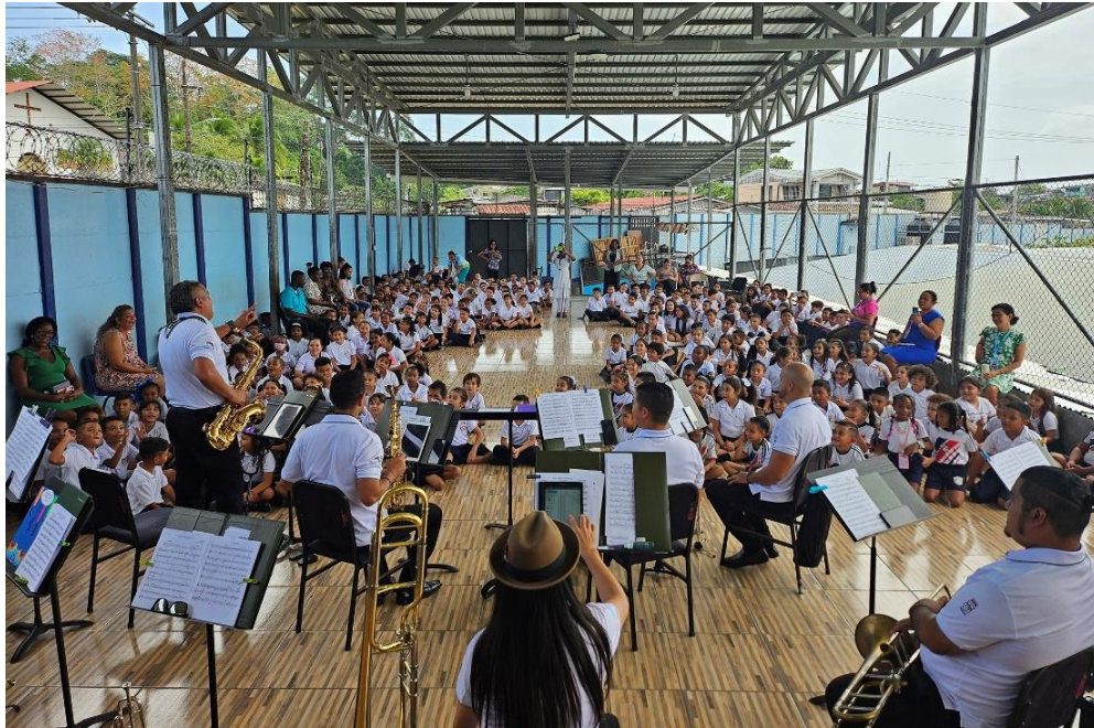
Concierto Didáctico - Banda de Conciertos de Limón Escuela "Margarita Rojas Zúñiga", Circuito 1 de Limón - Política Pública para la Niñez Limón, lunes 19 de febrero 2024