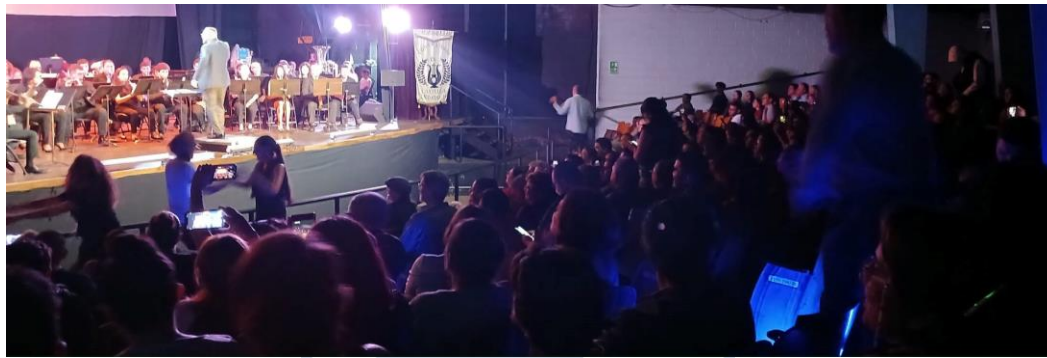
Banda de Conciertos de Heredia y Banda de Conciertos Avanzada de la Escuela de Música de Mercedes Norte Teatro Arnoldo Herrera del Conservatorio Castella - Jueves 6 de junio 2024