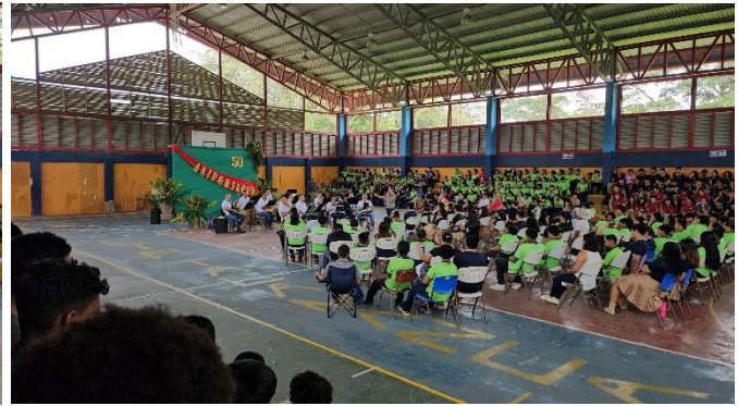
Banda de Conciertos de Limón | Colegio Técnico Profesional de Tamanca del Circuito 08 de Sula. Bratsi, Tamanca. Miércoles 8 de mayo, 2024 en.

Además de pertenecer a la región que es cuna del Calipso, nuestro ensamble caribeño ha sido uno de los mayores exponentes en la difusión y el fortalecimiento de la identidad afrocostarricense con destacada presencia en la Celebración del Día Nacional del Calypso en homenaje al natalicio de Walter Ferguson.