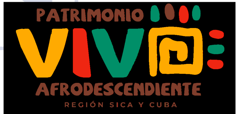
Imagen 2. Afiche con imagen gráfica el proyecto multipaís: Salvaguardia del Patrimonio Cultural Inmaterial Afrodescendiente de la Región SICA y Cuba 2022-2025.

Este proyecto tiene como objetivo realizar un proceso participativo de inventario que permita, en conjunto con las comunidades, la identificación y caracterización de las principales manifestaciones que conlleve a la construcción de mecanismos de acción para su salvaguardia.