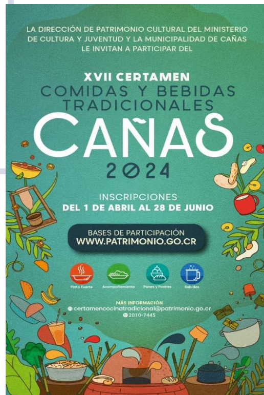
Imagen 1. Afiche de divulgación del XVII Certamen de Comidas y Bebidas Tradicionales del Cantón de Cañas 2024.

En esta ocasión en certamen se realiza en Cañas, Guanacaste. La apertura se realizó de 01 de abril y hasta el 28 de junio del 2024. La ceremonia de premiación se llevará a cabo en un acto público, tentativamente, el sábado 28 de setiembre en el Complejo Cultural de la Red de Frío en Cañas. Hasta ese momento se hará público el fallo del jurado y se anunciarán las personas ganadoras del Certamen.